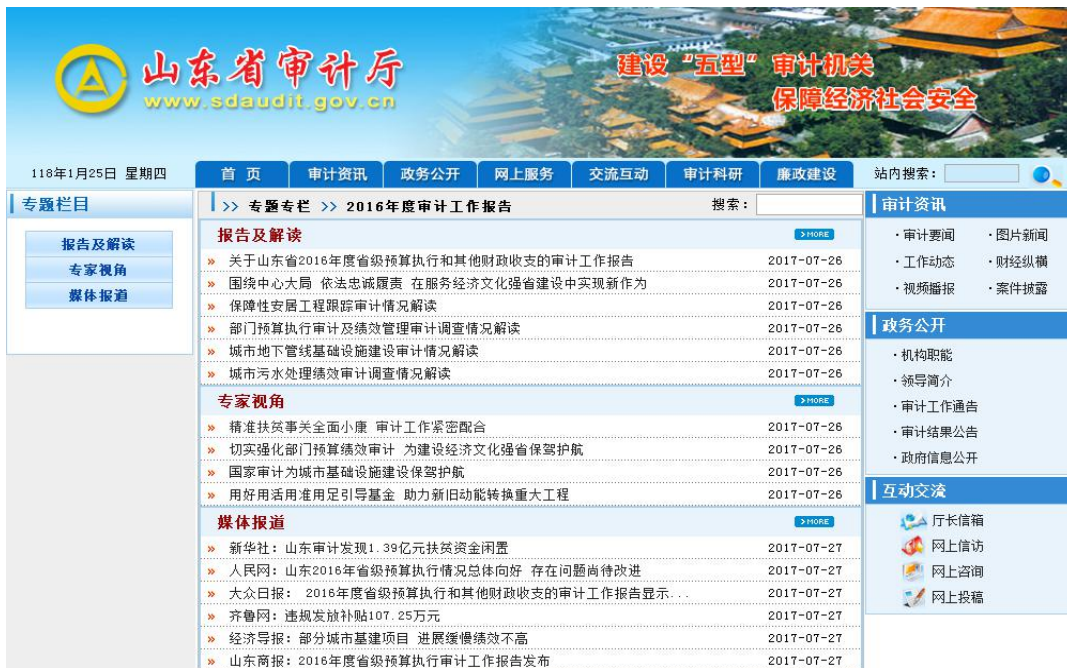
(图片 4: 2016 年度省级预算执行和其他财政收支审计工作报告解读情况及媒体报道情况)