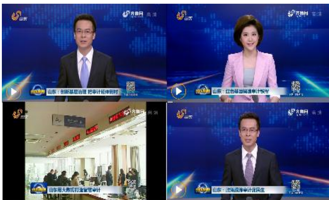
(图片1:《山东新闻联播》节目分4期集中报道省审计厅相关工作)

了山东审计近年来的工作特点和亮点,在社会上引起热烈好评(图片1);同时,还建立起舆情收集、研判、处置、回应机制,重大审计信息发布后,安排专职人员跟踪舆情、动态反馈,并与宣传、网信等部门保持沟通,遇到突发情况快速反应联动,及时主动发声,正面引导舆情。