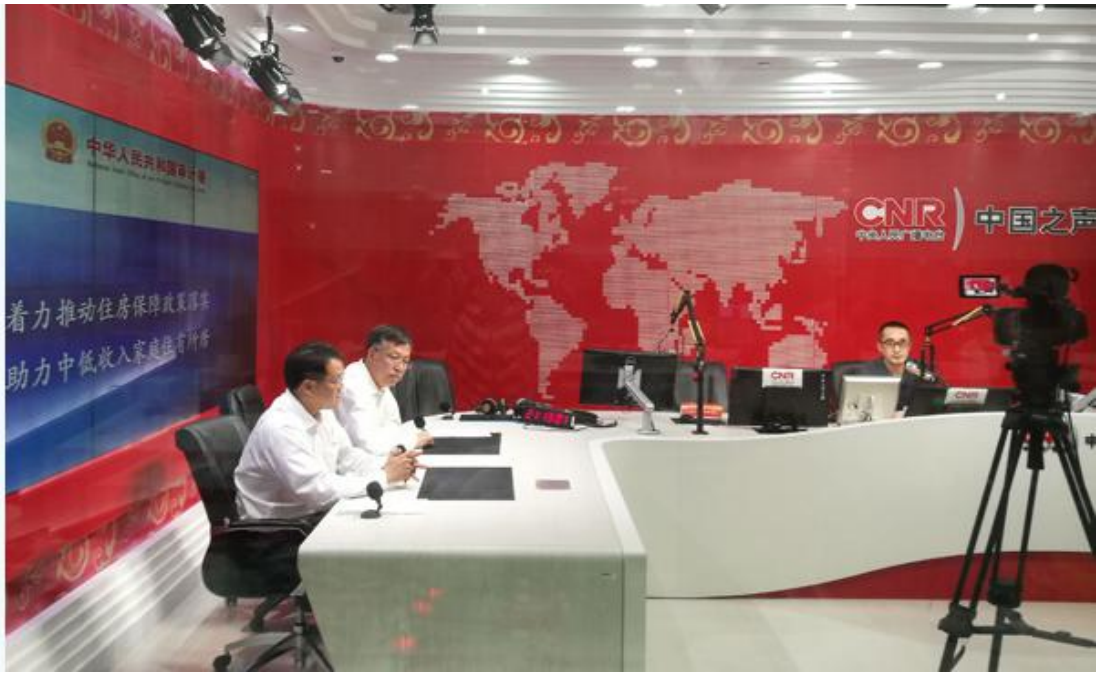
(图片 2: 厅领导参加中国之声“政务直通”栏目访谈, 介绍保障性安居工程审计相关情况)