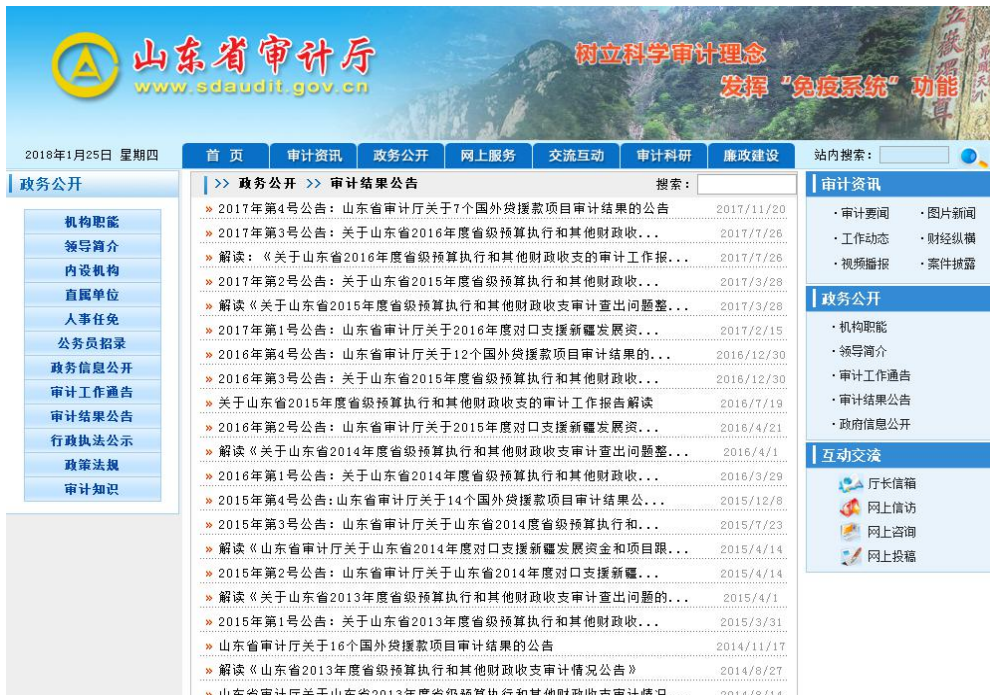
(图片 3: 2017 年度审计结果公告情况)

为便于社会公众理解，进一步健全解读回应机制，组织厅内相关业务处室对报告进行客观、全面的阐释，并邀请来自各行业的特约审计员对报告主要内容进行了全方位解读，还主动联系相关媒体提供详实情况，省内主要媒体做了集中深度报道，信息披露及时，受众广泛。（图片 4、图片 5）同时，厅党组书记、厅长切实履行“第一解读人”职责，通过发表署名文章、接受访谈等形式，对审计工作思路重点、重大审计项目开展情况及审计结果进行解读，主动回应舆论关切，先后在《中国审计》《中国审计报》《审计观察》发表署名文章 7 次，接受政府网访谈 1 次，接受新闻媒体采访 1 次。